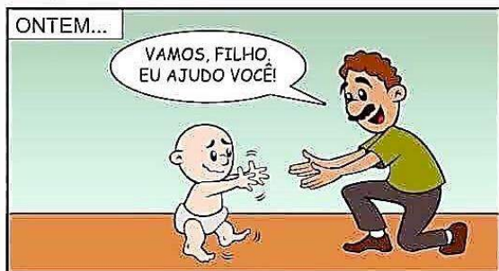
227 - HONRA TEU PAI...