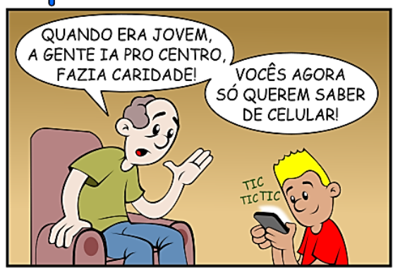
202 - NO CELULAR